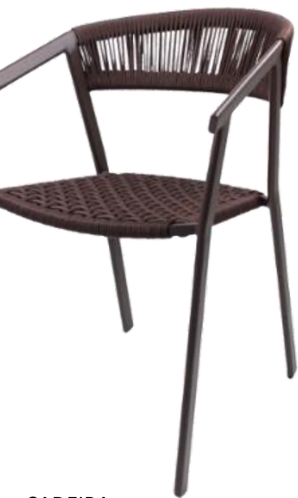
CADEIRA SONGO COLEÇÃO CARIBE